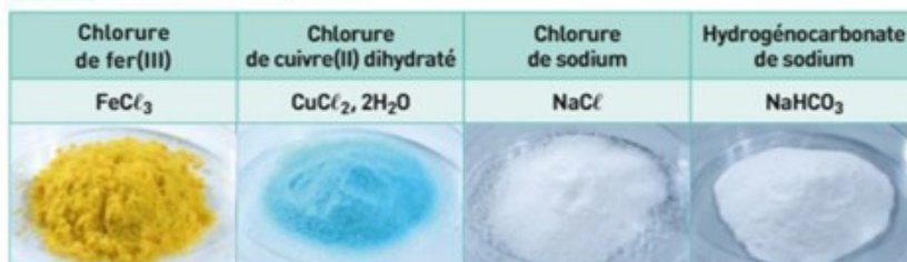
Doc. 1 Les solides étudiés